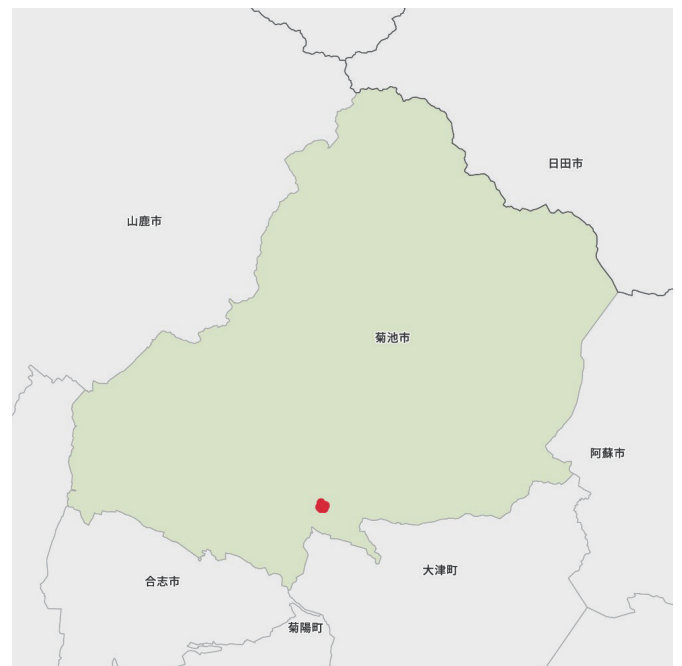
図-2 熊本試験地の位置 (●)

試験の圃場は厚層腐植質多湿黒ボク土の埴壤土に分類され腐植含量は9.9%、減水深は1～1.5cm/日である。農業用水は矢護川から分水されており、一年を通じて用水に不便はない。