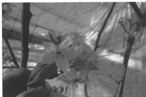
↑シアナミド処理:挫死が減少し健全花が多い ↓結実も良好