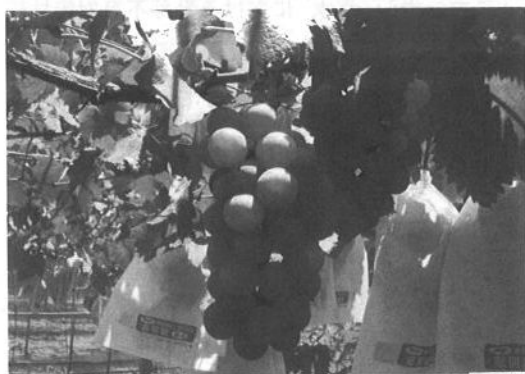
鹿児島県農業開発総合センター 果樹部 北薩分場