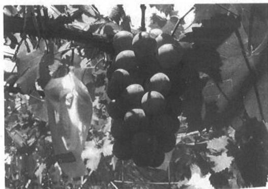
鹿児島県農業開発総合センター 果樹部 北薩分場