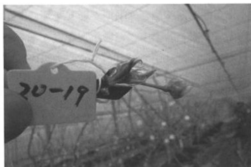
↑芽の充実が悪く花数が少ない(DVI=0.7) ↓花が小さかったり果梗が短い(DVI=0.7)