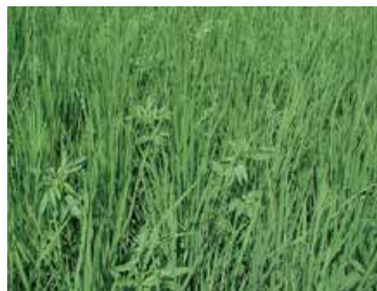
図-2 アメリカセンダングサ